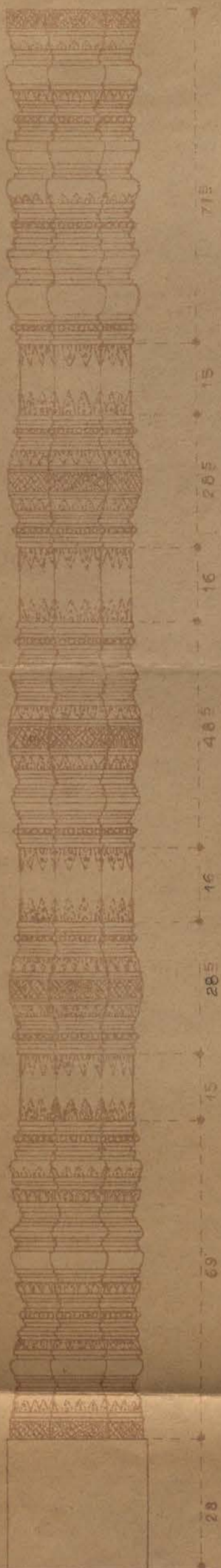
TOUR N. DE LA FACE E. (BAIE E.) AU PIED DE LA PYRAMIDE